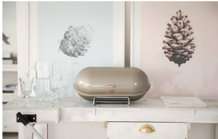
Isolierkanne , Warm Grey, 48,20€; Spacy Tray Oval , Warm Grey, 61,70€; Gebäckdose Classic Line Mandel, 27,90€ ; Brotkasten Ely , Mandel, 84,90€ ; Papierrollenhalter , Cool Grey, 24,20€ ; Mini Grandy , Cool Grey, 32,00€; Breadboy , Neusilber, 82,30€

Alle, die auch im Herbst und Winter auf Farbe nicht verzichten möchten, setzen Akzente mit bunten Eyecatchern ganz im Sinne des „Colorful Living“ Mottos von Wesco. Accessoires in Lemonyellow, Rot, Pink oder Mint verbreiten gute Laune und stimmen auf den nächsten Frühling ein!