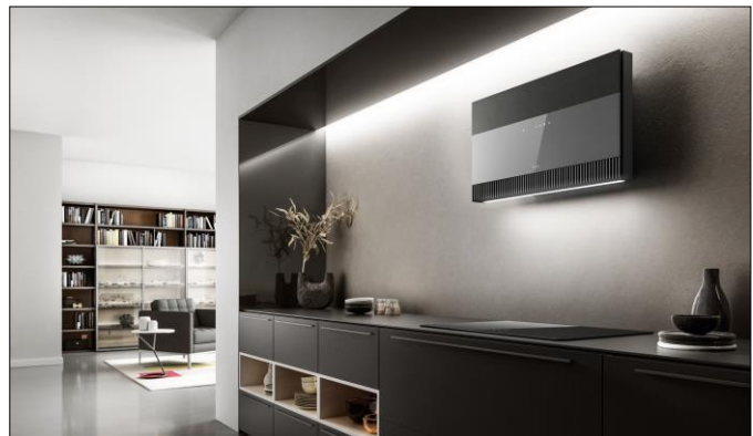
Modell Super Plat in grauem Glas mit Alu-Frontgitter in Gusseisen-Finish

Mit der Vertikalhaube Super Plat stellt Elica 2020 eine Neuheit vor, die sich dank der Breite von 55 und 80 cm problemlos zwischen Hängeschränke montieren lässt. Da die Möbel grundsätzlich auf einem 60er oder 90er Raster basieren, zerkratzt die Haube beim Öffnen der Front – um beispielsweise an die Filter zu kommen – die Schränke nicht. Was die eingangs beschriebene Effizienz angeht: Die Glasfront verbirgt gekonnt die Multi-d-Capture-Technologie, die Dämpfe und schlechte Gerüche von drei Seiten einfängt und für eine Spitzenleistung bei maximal 57 dB sorgt. Nicht zuletzt erfüllt Super Plat mit der Materialkombination aus Glas und Edelstahl in