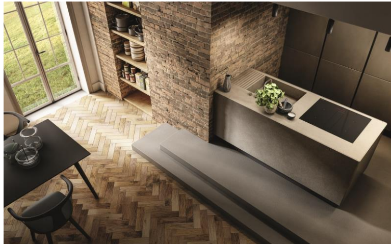
Kochfeldabzug NikolaTesla Fit

Wo gearbeitet wird, da fallen Späne. Und wo gekocht wird, da entsteht Wrasen – der möglichst effizient abgesaugt werden soll. Im Bereich Dunstabzugshauben und Kochfeldabzüge entwickelt der Weltmarktführer Elica sein Portfolio in Bezug auf neue Trends in der Küche regelmäßig weiter. Denn immer beliebter werden Lösungen, die sich auch für kleinere Räume eignen und sich dabei unauffällig in die Gesamtarchitektur integrieren.