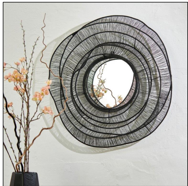
Wandspiegel Ascot , Eisendraht schwarz, D 90 cm, UVP 399,00 €