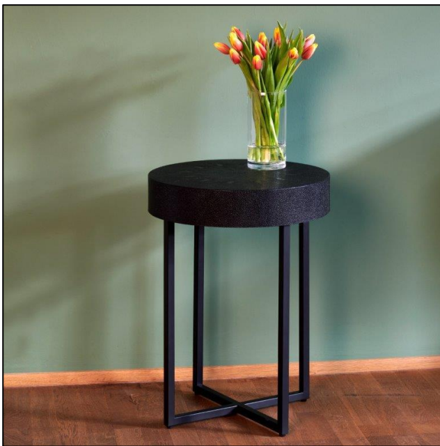
Beistelltisch Pascal Rochenhautimitat Schwarz Gestell Stahl matt Schwarz H 61 cm / D 45 cm, UVP 699,00 €

Handwerkliches Kulturgut, natürliche Materialien mit individuellen Strukturen und die Neuinterpretation beliebter Designformen prägen den Charakter der etablierten Marke seit Unternehmensgründung 1967. Dem Credo, gängige Wohnkonzepte durch Individualisierung immer wieder neu zu denken, ist man bis heute treu geblieben. Auch in 2023/24 stehen Produkte mit Unikatcharakter im Mittelpunkt der Range: objekthafte Möbel und dekorative Wohnaccessoires für einzigartige Einrichtungsmodelle, überraschende Materialvielfalt und die Nutzung alter Herstellungsverfahren stehen auch in der kommenden Saison im Fokus der Kollektionen.