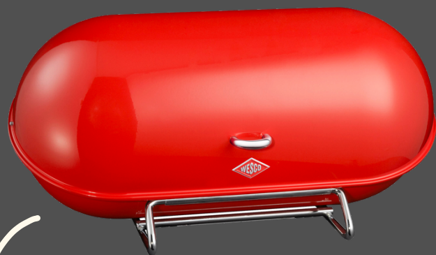
Wesco Brotkasten Breadboy 44,3 x 23 x 21 cm 96,50 €

länger frisch durch richtige Aufbewahrung