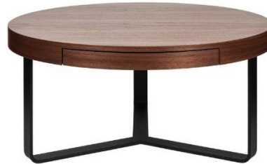
Couchtisch Harry mit Schublade, Farbe Walnuss, H 37 cm D 80 cm, 1.349 €

Hölzer wie Nussbaum, Walnuss oder Eiche verleihen jedem Raum einen ganz besonderen Wohlfühlfaktor. Kein Wunder, dass insbesondere diese Holzarten so gefragt sind. Als Couchtische neben dem Sofa oder als Mittelpunkt des Esszimmers – die hochwertigen Holzmöbel lassen sich vielseitig einsetzen. Couchtisch Harry überzeugt nicht nur durch stilvolles Aussehen, sondern auch mit seiner praktischen Schublade, in der sich Zeitschriften, Kerzen und Streichhölzer oder auch die geliebte Schokolade unkompliziert verstauen lassen.