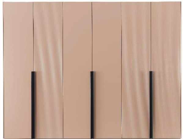
Kleiderschrank WK 121 LUGANO in Lack Puder, Drehtürenschrack 6-türig mit Rillenstruktur in der Front, ca. B 302, H 235, T 60 cm, ab 6.717 €

Die matte Farbpalette findet sich auch im Wohnzimmer wieder: Mit den neuen Couchtischen WK 807 , entwickelt von den Möbeldesigner:innen des Studio Labs , werden drei Modelle in verschiedenen Höhen und perfekt miteinander harmonisierenden Farbtönen angeboten. Dazu gesellen sich neue Polstermöbel, beispielsweise der neue Drehsessel WK 593 GÖTEBORG , der garantiert das Zeug zum Klassiker hat.