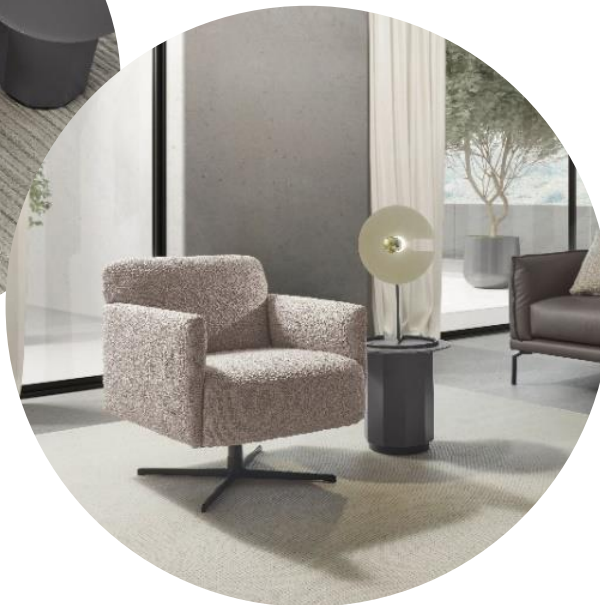
Sessel WK 593 GÖTEBORG in Boucle Greige, B 65, T 74, H 72 cm, 1.386 €