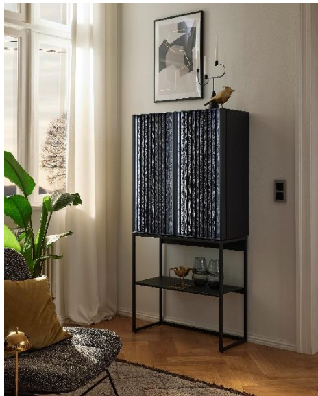
Wohnzimmerschrank TARGO , Eiche Anthrazit, ca. B 86, H 178, T 39 cm, 2.498 €

Mit dem Wohnzimmerschrank TARGO präsentiert Musterring das neue Herzstück für die eigene Hausbar. Von Weingläsern über Cocktailshaker und Spirituosen findet hier alles einen stilvollen Platz. Die gleichnamigen Wohnzimmermöbel der Kollektion setzen das gradlinige Design fort und ermöglichen so eine harmonische Ergänzung.