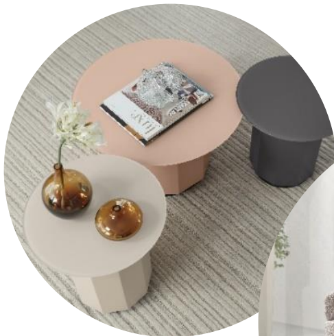
Couchtische & Beistelltische WK 807 , Platte Glas Satinato, Gestell MDF lackiert, in Puder, Cashmere und Umbragrau, in verschiedenen Größen erhältlich, H 40-45, Ø 40-60 cm, Set wie abgebildet 2.418 €