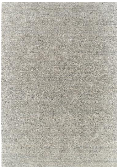
Teppich JustB! , 70 % Schurwolle, 30 % Viskose, handgewebt, in Grau und Creme-Silber, in verschiedenen Größen erhältlich, ab 170 x 240 cm, 769 €

Auch die JustB! Kollektion , entwickelt von Bettina Zimmermann, wird in diesem Jahr erweitert. So ergänzen unter anderem neue Teppiche die bestehenden Wohnprogramme und erstmalig bietet JustB! innerhalb dieser Kooperation auch passende Vorhänge an.