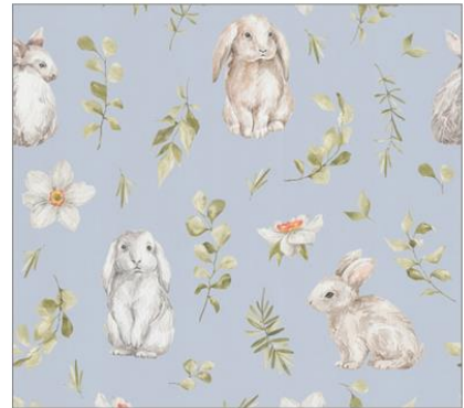
10 m Rolle jeweils 52,00 €: Nixe, Tierkinder, Meister Lampe (von links nach rechts)

Wichtig für Zimmer, in denen gespielt, getobt und geschlafen wird, ist ein gesundes Raumklima mit extraniedrigen Luftemissionen. Ganz familienfreundlich und sehr beruhigend für moderne Eltern, bestehen die lichtbeständigen Tapeten ausschließlich aus geprüften Rohstoffen – Zellstoff und textilen Fasern. Und da es gerade bei klebrigen Kinderhänden, fliegenden Essensresten und Kunst an der Wand sehr hilfreich ist, können leichte Verschmutzungen einfach feucht abgewischt werden.