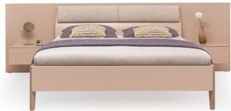
Bett WK 121 LUGANO mit geschwungenem Kopfteil: Lack puder, Furnier Eiche sahara, (abnehmbares) Kissen Stoff Cetara petal, Liegefläche ca. 180 x 200 cm, 6.361,- € (Preis für Bettanlage mit Paneele und Nakos)