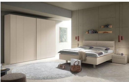
Schrank WK 121 LUGANO (links): Gleittürenschränk 2-türig, Korpus/Front: Lack kaschmir, ca. B 300, H 235, T 60 cm, 6.232,- €

Neben einer großen Auswahl an Formaten, Rückwänden und zahlreichen weiteren Features sind die Möglichkeiten bei der LUGANO-Schrankkonfiguration außergewöhnlich breit gefächert: Zur Auswahl stehen – zusätzlich zu den üblichen Türfronten – Dreh- und Gleittürenschränke, außerdem Eck-Lösungen, gerundete Außenseiten sowie Anpassungsmöglichkeiten für Deckenhöhen bis 290 Zentimeter. Auch die optimale Nutzung eventueller Dachschrägen ist mit diesem System problemlos möglich.