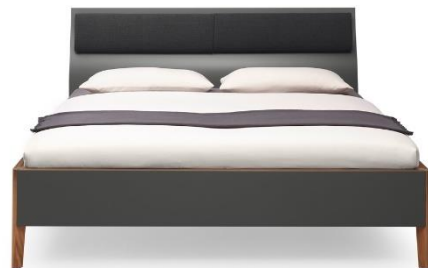
Bett WK 121 LUGANO mit geschwungenem Kopfteil: Lack quarz, Furnier Nussbaum natur, (abnehmbares) Kissen Stoff Weekend anthracite, Liegefläche ca. 180 x 200 cm, 2.923,- €