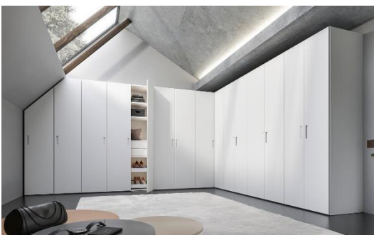
Schrank WK 121 LUGANO (unten): Drehtürenschränk Eckkombination, Korpus/Front: Lack blütenweiß, Griff eingelassen, ca. B 462 x 392, H 235, T 60 cm, Preis auf Anfrage