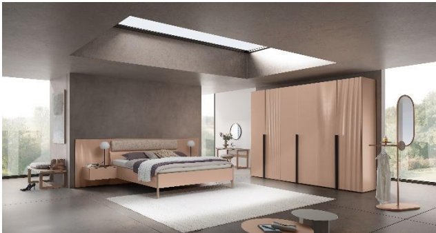
Schrank WK 121 LUGANO (oben): Drehtürenschränk 6-türig mit Rillenstruktur, Korpus/Front in Lack puder, Griffe in Metall schwarz, ca. B 302, H 235, T 60 cm, 7.372,- €