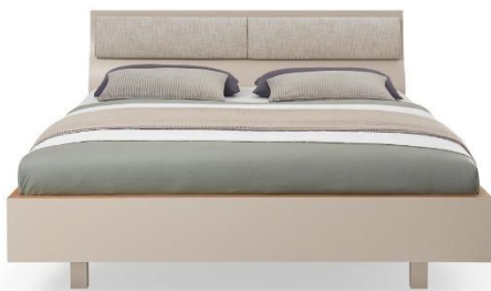
Bett WK 121 LUGANO mit geschwungenem Kopfteil: Lack kaschmir, Furnier Eiche canyon, (abnehmbares) Kissen Stoff Cetara natural, Liegefläche ca. 180 x 200 cm, 3.246,- €