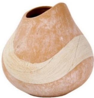
Gefäß Suna (links), Keramik in Terracotta, H 20-23,5 cm, D 23 cm, 99,00 €

Durch ihre moderne Formensprache definieren sich die handgefertigten Keramikgefäße Suna und Bahha . Sie fügen sich harmonisch in jeden Wohnraum ein und setzen sowohl Trockenblumen als auch frische Sträuße gekonnt in Szene.