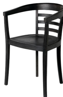
Stuhl Julius , Eiche massiv in Schwarz, 53 x 53 x 78 cm, in vier Holzvarianten erhältlich, 629 €