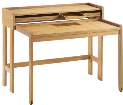
Sekretär Modesto , Eiche massiv, 120 x 58 cm, T ausgezogen 88 cm, H 75 cm, H gesamt 93 cm, in fünf Holzvarianten erhältlich, 2.499 €

Neben zahlreichen Neuheiten präsentiert Lambert in diesem Jahr auch stolz zwei seiner Jubiläums-Kollektionsstücke auf der Ambiente. Sekretär Modesto überzeugt seit 20 Jahren, Stuhl Julius bereits seit 30 Jahren mit gutem Design und kunstvoller Verarbeitung. Sie verdeutlichen, wie zeitlos wertvoll die Möbel der Lifestyle-Marke sind.