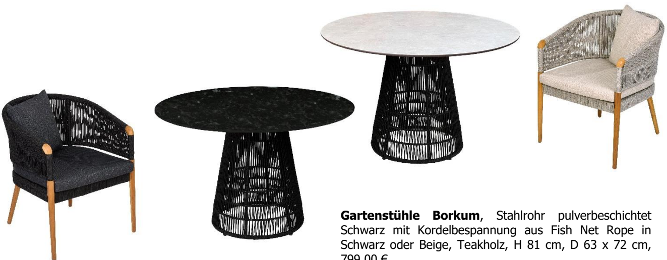
Gartenstühle Borkum , Stahlrohr pulverbeschichtet Schwarz mit Kordelbespannung aus Fish Net Rope in Schwarz oder Beige, Teakholz, H 81 cm, D 63 x 72 cm, 799,00 €

Mit der neuen Serie Borkum erweitert Lambert seine Outdoorkollektion um zwei bequeme Stühle, die Lust auf lange Sommertage im Freien machen. Vervollständigt wird das Ensemble durch den Tisch Keiko . Die Kombination aus robuster Kordelbespannung und wetterbeständiger HPL-Platte verspricht eine hohe Qualität und Langlebigkeit der Möbel.