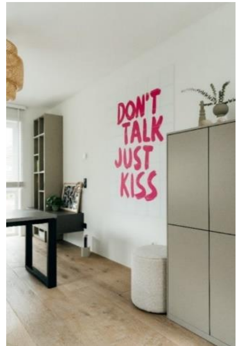
Rechts: Highboard KARA-FRAME in Lack Cashmere, ca. B 75, H 147, T 50 cm, 1.195,- €