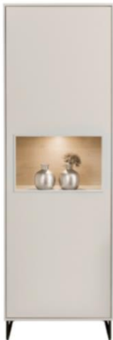
Links: Vitrine KARA-FRAME in Lack Brillantgrau, Kufen schwarz matt, ca. B 62, H 191, T 40 cm, 1.287,- € zuzügl. Beleuchtung

Die soft-beigen KARA-FRAME-Möbel verleihen Tina Ruthes Büro eine sanfte, feminine Eleganz. Sie fügen sich nahtlos in die warme, lichtdurchflutete Atmosphäre ein und machen ihr Homeoffice zu einem Ort, der zum Verweilen und kreativen Arbeiten einlädt.