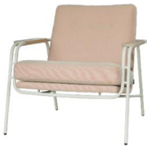
Sessel MT51 mit offener Armlehne und Armlehnenüberzug, Stoff Merit Lychee Gelato (PG D), Metallgestell RAL 1013 Perlweiß, ca. B 81, H 82, SH 45, T 84, ST 53 cm, inkl. aufgelegter Armlehne in Holz, 1.819,- €

Tina Ruthe setzt in ihrem Homeoffice auf den MATCH IT! -Sessel, der mit seiner großen Auswahl an Modellen, Bezugstoffen und Farben perfekt auf individuelle Design- und Komfortwünsche abgestimmt werden kann. In zartem Rosa setzt er in ihrem Büro einen feinen Farbakzent, der dem Raum Frische und Leichtigkeit verleiht und ihre weibliche Handschrift erkennen lässt.