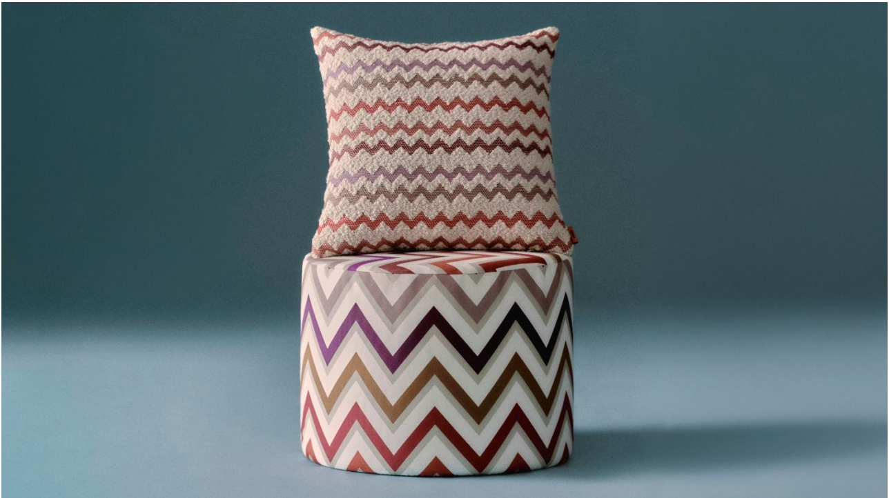
Outdoor-Pouf Watamu (490 €) und Outdoor-Kissen Capri (250 €)

Bald richten wir uns auch auf unseren Terrassen und Balkonen wieder stilvoll ein und freuen uns über die schönste Jahreszeit – mit zusätzlichem Wohnraum unter freiem Himmel. Missoni Home bietet hierfür individuelle Outdoor-Wohnaccessoires auf höchstem Qualitätsniveau an, die die unverwechselbare Ästhetik der Marke widerspiegeln.