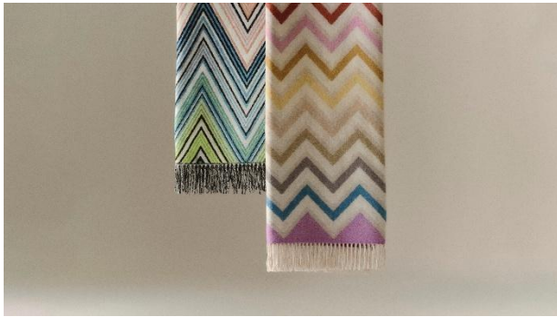
4 + 5